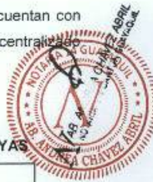
CUADRO No. 2 PARROQUIAS RURALES DE LA PROVINCIA DEL GUAYAS

De los 25 cantones que tiene la provincia del Guayas solo 11 cuentan con parroquias rurales, administradas por el Gobierno Autónomo Descentralizado Rural (antes denominada Junta Parroquial Rural).