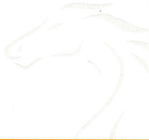
Jimmy Jairala Vallazza PREFECTO PROVINCIAL DEL GUAYAS