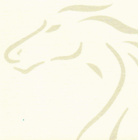
Arq. Mónica Becerra Centeno PREFECTA PROVINCIAL DEL GUAYAS (E)