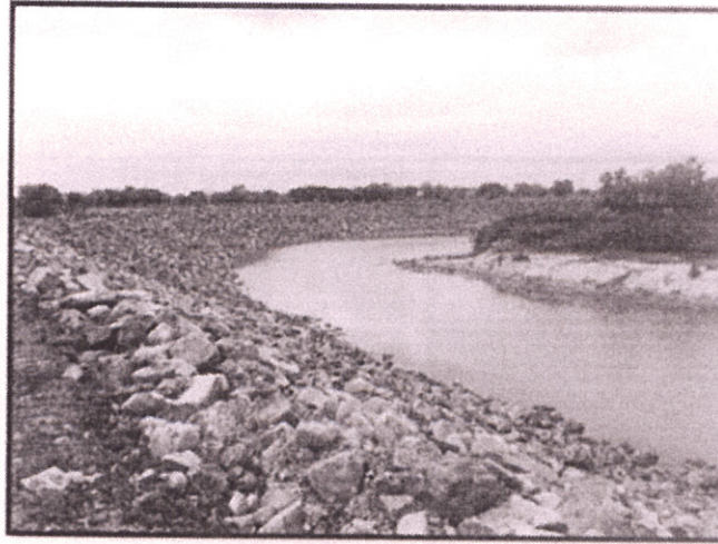
Enrocado en vista general 0+450