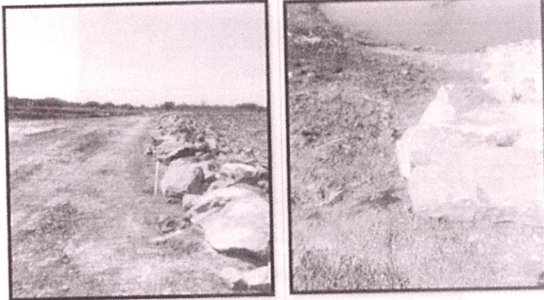
Abscisado en la cresta del muro enrocado