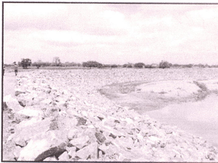
Enrocado en el talud del muro Abscisa 0+300