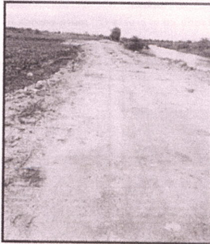
Vía de Acceso a la obra

Dirección: Illingworth 108 y Malecón Telf: (593 - 04) 2511 677 www.guayas.gob.ec