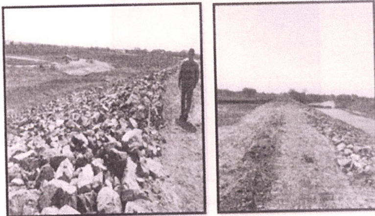
Talud enrocado y camino en cresta del muro

Dirección: Illingworth 108 y Malecón Telf: (593 - 04) 2511 677 www.guayas.gob.ec