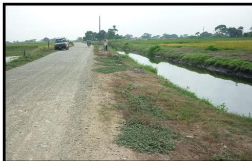
Figura 2. El ancho de la vía actual variable (de 5 a 6 m). Paralelo a la vía en la mayoría de su longitud existe un canal de grandes dimensiones.