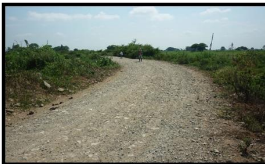
Figura 1. Estado Actual de la vía.